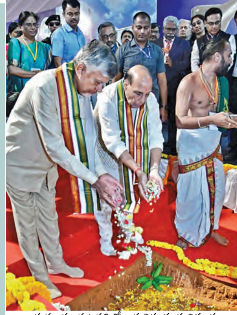
శుక్రవారం పుట్టపర్తిలో ఆధునిక యుద్ధ విమాన ప్రాజెక్టుకు శంకుస్థాపన చేస్తున్న రక్షణమంత్రి రాజ్ నాథ్ సింగ్, సీఎం చంద్రబాబు

23 నెలల్లో 23లక్షల కోట్ల పెట్టుబడులు తెచ్చాం.. సీమను డ్రాట్ జోన్ నుంచి గ్రోత్ జోన్ గా మారుస్తున్నాం ఆత్మనిర్ణయ భారత్ లో ఎపి ముఖ్యపాత్ర యుద్ధ విమాన ప్రాజెక్టు శంకుస్థాపనలో సీఎం చంద్రబాబు