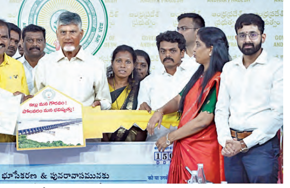
పోలవరం నిర్వాసితులకు ఆర్ అండ్ ఆర్ ప్యాకేజీని అందిస్తున్న సీఎం చంద్రబాబు, మంత్రి రామానాయుడు

వచ్చిన భూములు పోతే బా... ఏ ఏ ఏ... నిర్వాసితులకు అన్యాయం జరగని వ్యవస్థ... ప్రాజెక్టును రోడ్డు నిర్మిస్తున్నాం. 2022లో వరదల సమయంలో పోలవరం ప్రాజెక్టులో నేను పర్యటించాను. వరద బాధితులకు కనీసం భోజనం, నీళ్లు కూడా నాటి ప్రభుత్వం ఇవ్వలేదు. విశాఖలో హుద్ హుద్ రోజులు అక్కడే ఉండి పరిస్థితి చక్కదిద్దాం. 2019 కూడా తర్వాత మా ప్రభుత్వం కొనసాగి ఉండి పోలవరం 2020కి పూర్తయ్యింది. గత ప్రభుత్వ నిర్వాసితులకు, నిర్జన గ్రామ వల్ల డయా ప్రాజెక్టు వల్ల దెబ్బతినేలా చేశారు. పోలవరం నిర్వాసితులకు పరిహారం పెంచుతామని హామీ ఇచ్చి మోసం చేశారు. గత పాలకులు అధికారులను మార్చారు... ప్రాజెక్టును నాశనం చేశారు. పోలవరం ప్రాజెక్టును మళ్లీ గాడిలో పెట్టాలి... 2027 పుష్కరాల కంటే ముందే ప్రాజెక్టును పూర్తి చేసి జాతికి అందికే చేస్తాం. గోదావరి కావేరి నదుల అనుసంధానం జరుగుతుంది. గంగా - కావేరి నదుల అనుసంధానం కావాలనేది మా కోరిక. ఇది చేస్తే దేశంలో నీటి ఎద్దడి అనేది ఉండదు" అని ముఖ్యమంత్రి అన్నారు. చంద్రబాబు సీఎం అయ్యాకే మాకు మంచి రోజులు: సీఎం చంద్రబాబు పోలవరం నిర్వాసితులతో నిర్వహించిన ముఖాముఖీలో నిర్వాసితులు తమ అభిప్రాయాలను... క్షేత్రస్థాయి పరిస్థితులను వివరించారు. గతంలో పరిహారం, ఆర్ అండ్ ఆర్ పనులు ఎలా ఉండేవి... ఇప్పుడు ఎలా జరుగుతున్నాయోనే అంశాన్ని సీఎం వివరించారు. గత ప్రభుత్వ హయాంలో పోలవరం ప్రాజెక్టు నిర్వాసితులకు... తమ పరిహారం మీద తాము పూర్తిగా నమ్మకాన్ని